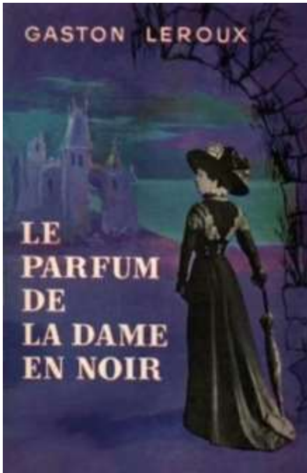
Gaston Leroux (1868-1927) Le Parfum de la Dame en noir