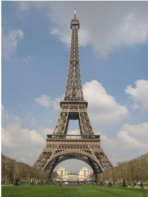
Figure 1 Monter en (au) troisième ?

ou plutôt : « Quand ne pas monter en troisième ? »