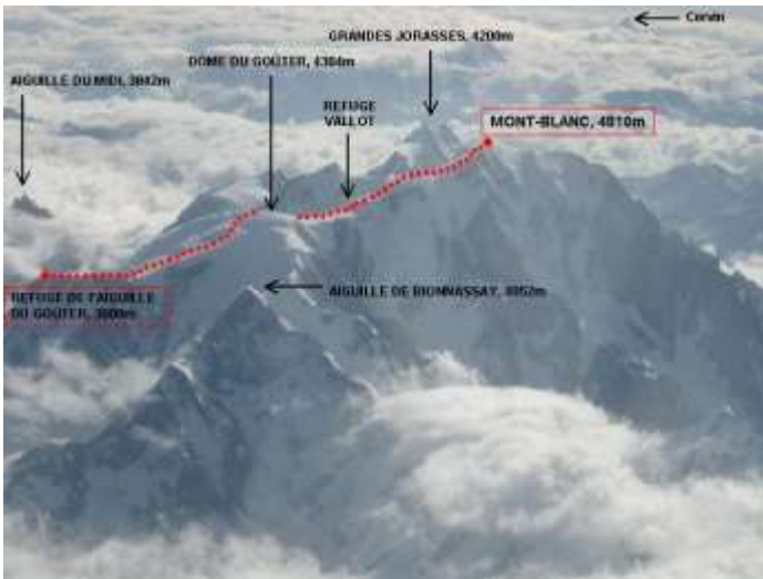
Figure 1 Grimpez en troisième

(Les expressions en italique font l'objet d'un cours dans le site).