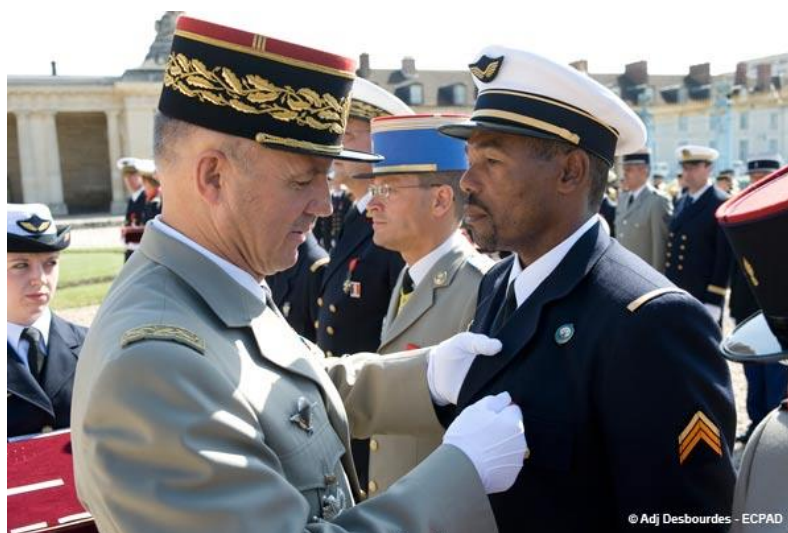
Honneur sur honneur ?